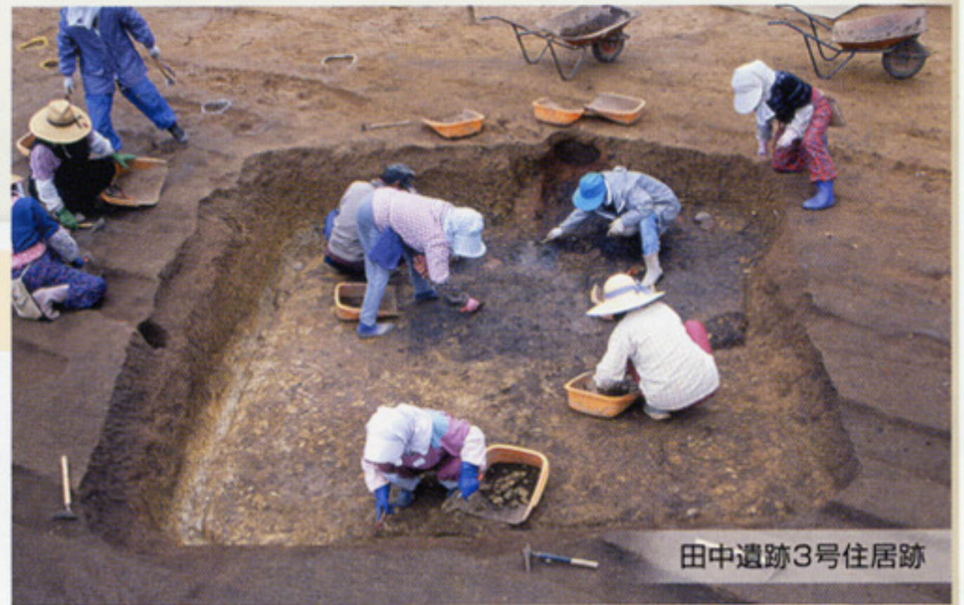
田中遺跡3号住居跡

須賀川市の委託を受けて、ほ場整備と道路をつくるため一昨年度から調査をしています。昨年度は、館の北側で東西に平行してのびる堀跡が見つかりましたが、本年度はその堀跡の続きを発掘する予定です。