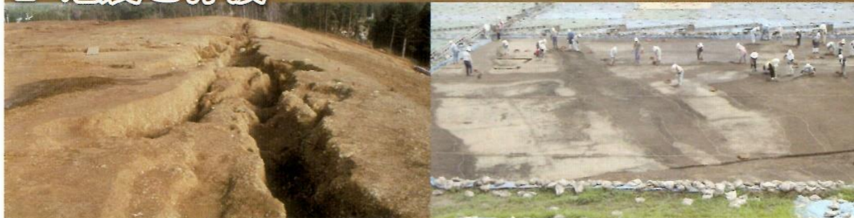
▲相馬市段ノ原B遺跡の地割れ