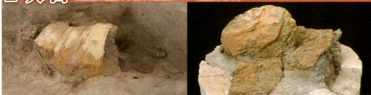
▲渋川市金井東裏遺跡で見つかった「甲を着た古墳人」