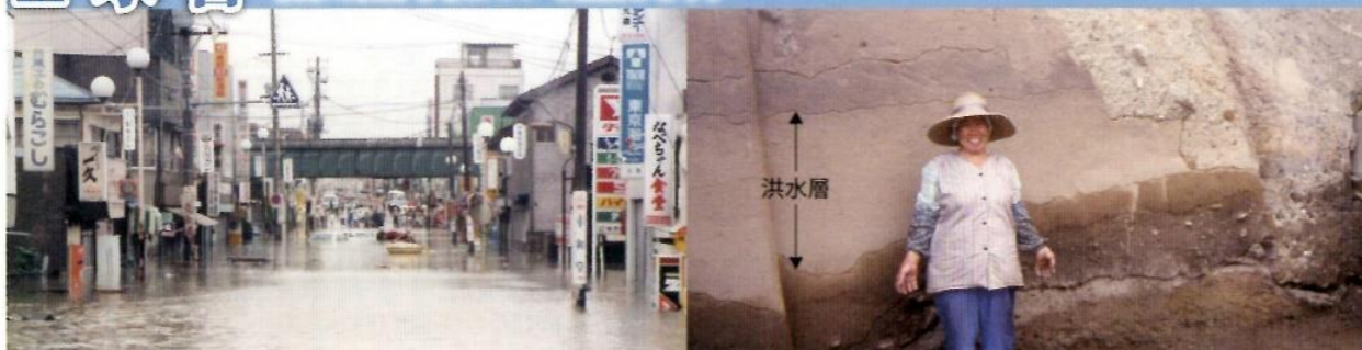
▲8・5水害の被害状況