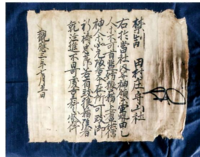
富塚慎一氏所蔵文書

(花押) 禁制 田村庄守山社 右、於当社内并神領等、軍勢・甲乙人等不可有監妨狼藉之上者、早供儒・神人等、如元帰居本在所、可致御祈祷忠節、若有致狼藉族者、就注進、不日可处罪科之状如件、 観応三年七月五日