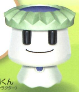
大安場くん (史跡公園キャラクター)

この手引き書は、幼稚園・保育所や小学校・中学校、公民館活動などの各種団体に大安場史跡公園を有効に活用していただくために作成したものです。当史跡公園の利用に際してご一読いただき、お役立てください。皆様のご来園をお待ちしております。