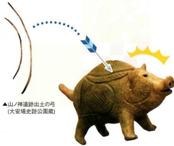
▲山ノ神遺跡出土の弓 (大安場史跡公園蔵)

縄文人たちは、イノシシをかたどった土製品を作っていました。数は多くないものの、各地の遺跡から出土しています。右の写真に示したのは、青森県弘前市の十腰内2遺跡から出土した縄文時代後期のイノシシ形の土製品です。鼻や眼、2つに割れた蹄など、イノシシの特徴が細かく表現されています。このような土製品は、縄文時代中期以降に多くなります。自然の恵みに感謝する気持ちを込め、何らかの儀礼に用いたのではないのでしょうか。自然と共生していた縄文時代ならではの品です。