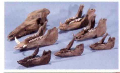
薩摩鹿兒島藩島津家屋敷跡 第2遺跡出土のブタ骨