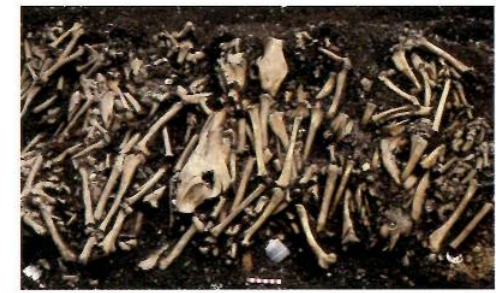
▲三栄町遺跡でみつかった 獣骨の集積状況

江戸の遺跡からは、数は多くないながら、ブタの骨も出土しています。薩摩藩の江戸屋敷があった薩摩鹿兒島藩島津家屋敷跡第2遺跡からは、大型のブタの骨がたくさん出土しました。鹿兒島といえば黒豚の産地です。これらのブタは、薩摩の黒豚であったかもしれません。薩摩藩江戸屋敷の人たちは、どのような料理でこのブタを食べたのでしょうか。興味は尽きません。