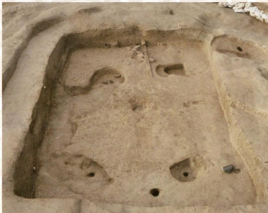
中平遺跡14号竪穴建物跡