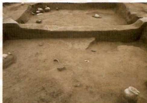
中平遺跡14号竪穴建物跡の堆積状況