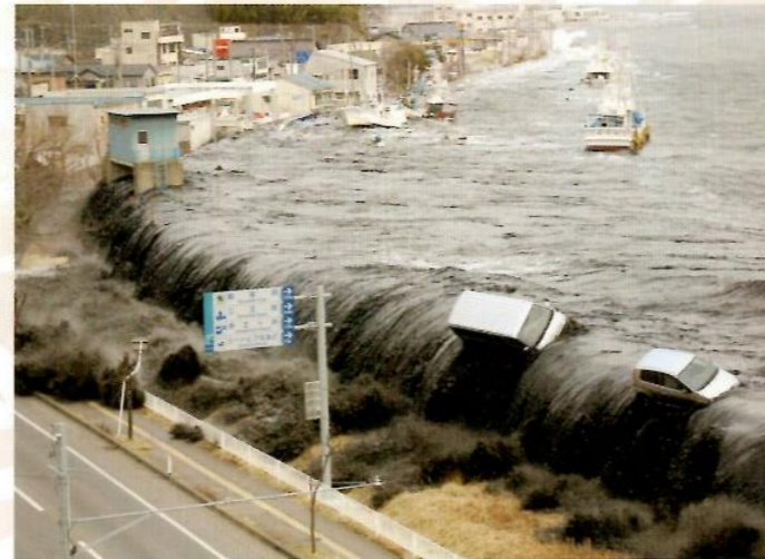
東日本大震災で宮古市を襲う津波

古来より、日本は多くの津波災害に襲われてきました。平成23年の東日本大震災でも、多くの人の命が津波によって奪われています。古い記録にも津波災害の記録がたくさん残されています。また、遺跡の発掘調査においても、津波による堆積物と思われる砂に覆われた遺跡が見つかることがあります。