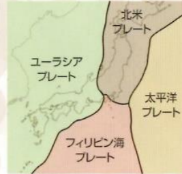
日本周辺のプレート

古来、日本は大きな地震に何度も襲われてきました。古い歴史書などには、たくさんの震災記録が残されています。また、発掘調査を行っている、地震の痕跡を目にすることがあります。