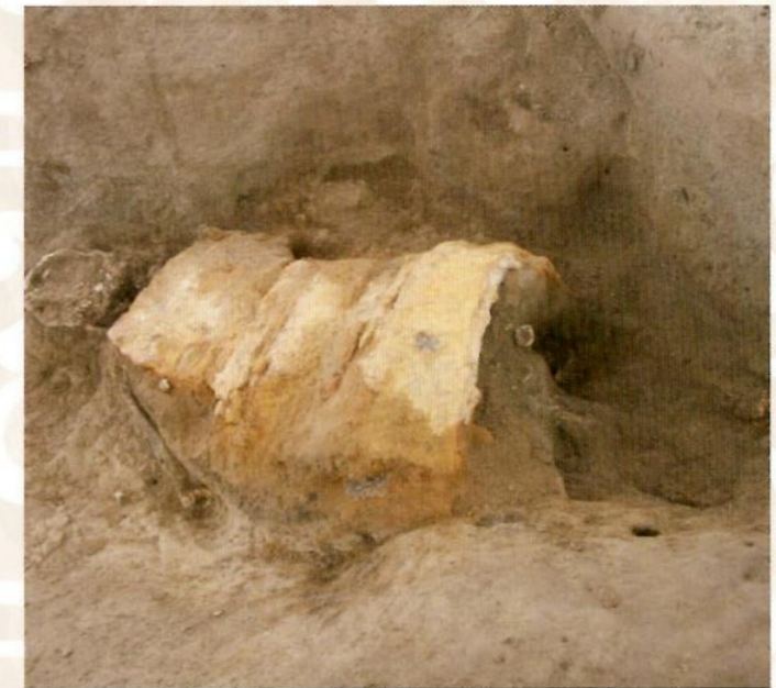
金井東裏遺跡の「甲を着た古墳人」

2度目の噴火は6世紀半ばごろだったと思われます。この時の噴火では、「日本のポンペイ」として有名になった黒井峯遺跡が火山噴出物に覆われました。そして、この時の火山噴出物は偏西風に乗って福島県にまで達し、農作物などに被害を出したものとされます。この噴火による火山灰は、安積町東丸山遺跡(現・カルチャーパーク)などで確認されています。