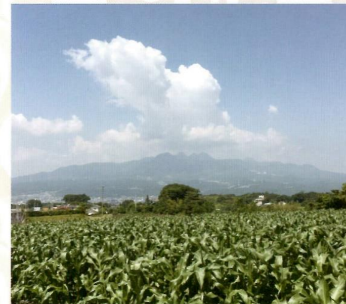
はるなでん 榛名山

日本には全部で111の活火山があります。そのうち、東北地方に存在するのは18、福島県には5つの活火山があります。活火山は噴火の頻度などによってランク分けされており、噴火頻度の高い火山は常時観測火山となっています。福島県では、吾妻山、安達太良山、磐梯山の3つが常時観測火山となっています。