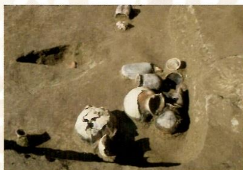
中平遺跡14号竪穴建物跡の遺物出土状況