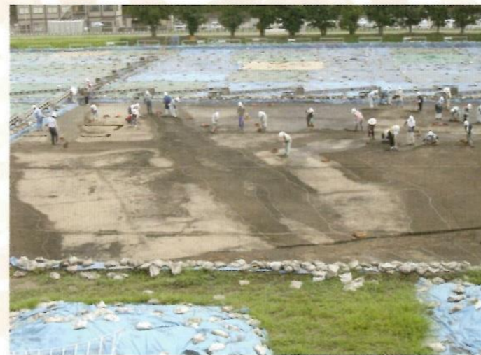
仙台市沓形遺跡の津波堆積物

巨大地震に伴う津波は、沿岸部を襲うだけでなく、内陸部にまで浸水します。東日本大震災では、沿岸から内陸部3kmまで浸水した地点もあります。貞観11年(869)に起きた貞観地震に伴う津波は、多賀城にまで押し寄せ、周辺を水浸しにしたことが記録に残っています。