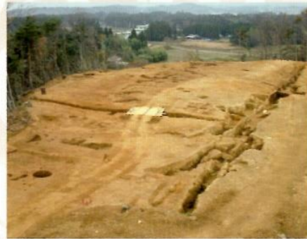
段ノ原B遺跡の地割れ痕跡

相馬市の段ノ原B遺跡は、今から約6,000年前の縄文時代前期を中心とした集落遺跡です。相馬中核工業団地の造成に伴い、昭和60年から平成3年にかけて発掘調査が行われました。